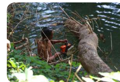
ปรับปรุงและพัฒนาคลองสาธารณะ เพิ่มการรองรับและระบายน้ำ เพื่อป้องกันน้ำท่วม