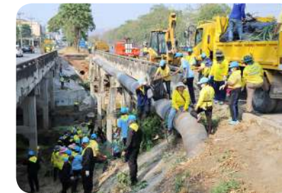
ปลูกจิตสำนึกให้ประชาชนรักน้ำ โดยไม่ทิ้งขยะและของเสียลงคลองสาธารณะ