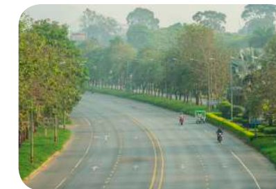
สร้างสาธารณูปโภคพื้นฐานให้ทั่วถึงและเป็นธรรม