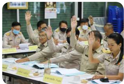
การบริหารงานให้มีประสิทธิภาพตามหลักธรรมาภิบาล รวดเร็ว โปร่งใส เป็นธรรม ตรวจสอบได้

ได้ควบคุมการบริหารงานให้มีประสิทธิภาพ ตามหลักธรรมาภิบาล รวดเร็ว โปร่งใส เป็นธรรม ตรวจสอบได้ เน้นการมีส่วนร่วมของประชาชนในชุมชน