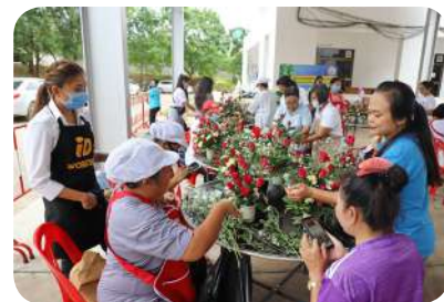
ส่งเสริมพัฒนาอาชีพ และมีมือแรงงาน

ได้ส่งเสริมอาชีพ พัฒนาสินค้าชุมชน ตลาดชุมชน ร้านค้าชุมชน รองรับวิกฤติตามแนวคิดเศรษฐกิจพอเพียง