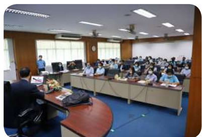
อบรมเพิ่มความรู้ให้แก่พนักงานในการปฏิบัติหน้าที่