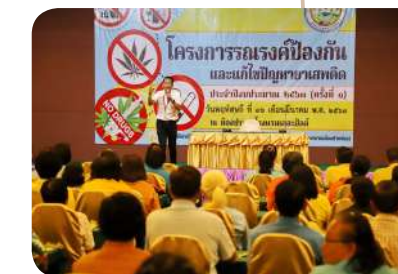
การป้องกัน และขจัดปัญหา ยาเสพติดทุกรูปแบบ