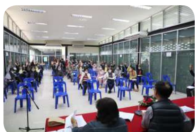
ส่งเสริมประชาธิปไตยและการมีส่วนร่วมของประชาชน