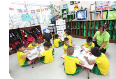
พัฒนาคุณภาพการศึกษาในทุกระดับของสถานศึกษาในสังกัดเทศบาลเมืองปากช่อง