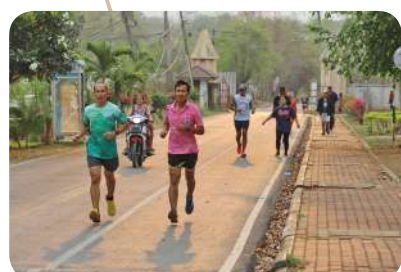
เพิ่มสวนสาธารณะและสถานที่ออกกำลังกาย