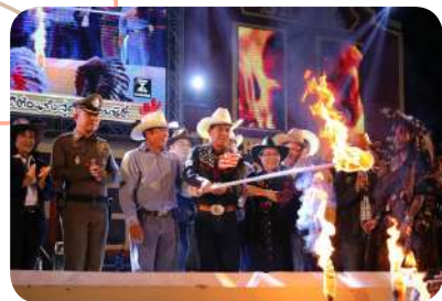
ส่งเสริมเอกลักษณ์ ความเป็นเมืองคาวบอย

ได้ส่งเสริมกิจกรรมท่องเที่ยวเชิงนิเวศน์ ศิลปะ วัฒนธรรม ประเพณี ภูมิปัญญาท้องถิ่น ให้เป็นศูนย์กลางการท่องเที่ยวและนันทนาการ