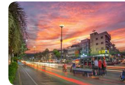
จัดผังเมืองให้เป็นระบบสมเป็นเมืองท่องเที่ยวและเมืองน่าอยู่