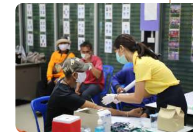
ส่งเสริมดูแลสุขภาพประชาชน ควบคุมการแพร่ระบาดของโรคติดต่อและไม่ติดต่อ