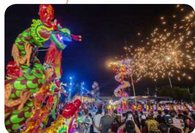
กิจกรรมส่งเสริมการท่องเที่ยวและธุรกิจท่องเที่ยว