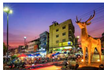
พัฒนาตลาดไนท์พลาซ่า ให้นำซื้อ นำเดิน