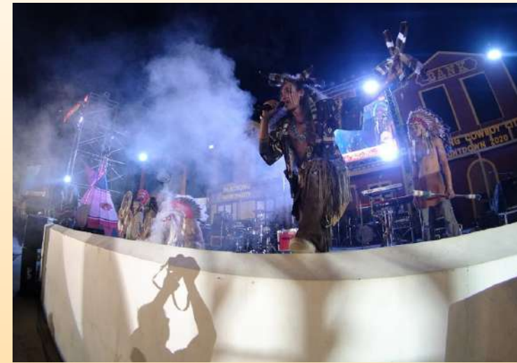
การแสดงคาวบอยโชว์ โชว์การใช้อาวุธ โชว์การเล่นไฟ บูชาเทพเจ้า โชว์กระบองไฟ โชว์ฟันไฟ

Countdown 2020 เทศบาลเมืองปากช่อง ประจำปีงบประมาณ 2563 มีวัตถุประสงค์เพื่อสร้างเอกลักษณ์เฉพาะให้อำเภอปากช่อง ให้เป็นที่รู้จักของบุคคลทั่วไปในรูปแบบเมืองคาวบอย กระตุ้นความสนใจของนักท่องเที่ยวทั้งชาวไทยและชาวต่างประเทศ ให้เดินทางมาท่องเที่ยวในอำเภopakช่องเพิ่มมากขึ้น และเน้นการกระตุ้นเศรษฐกิจการท่องเที่ยว และสร้างรายได้ให้กับประชาชนชาวอำเภอปากช่อง โดยจะจัดโครงการดังกล่าว ในระหว่างวันที่ 25-31 ธันวาคม สวนสาธารณณะเฉลิมพระเกียรติ (เขาแคน) เป็นประจำปี