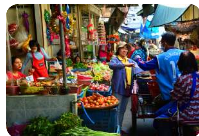
พัฒนาตลาดสดเทศบาลให้ทันสมัยและถูกสุขลักษณะ