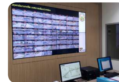
ขยายจุดติดตั้งกล้องวงจรปิด เพื่อป้องกันการก่ออาชญากรรม ปกป้องชีวิตและทรัพย์สิน