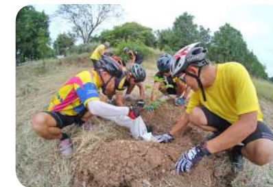
ปรับปรุงภูมิทัศน์ ปลูกต้นไม้ยืนต้นเพิ่มพื้นที่สีเขียวและสวนสาธารณะ